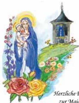
Herzliche Einladung zur Maiandacht

Die Bredenborner Senioren sind am Mittwoch, 07. Mai, ab 14.30 Uhr ins Pfarrheim eingeladen. Diesen Nachmittag werden wir mit einer Maiandacht im Marienmonat beginnen. Kaffeetrinken, Gymnastik und weitere Unterhaltung schließen sich an. Auf viele Besucher dieses Senioren nachmittags freut sich der Vorstand der „Alten Liebe“.